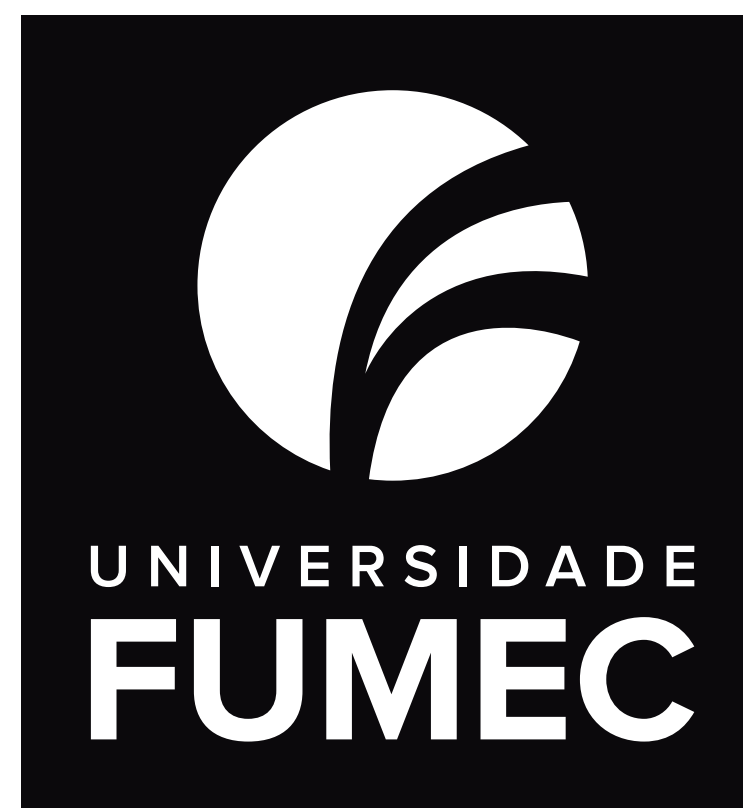
Monocromatica | Branca