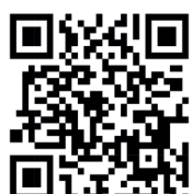
MAPA DE RISCO