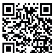
MAPA DE ACESSIBILIDADE