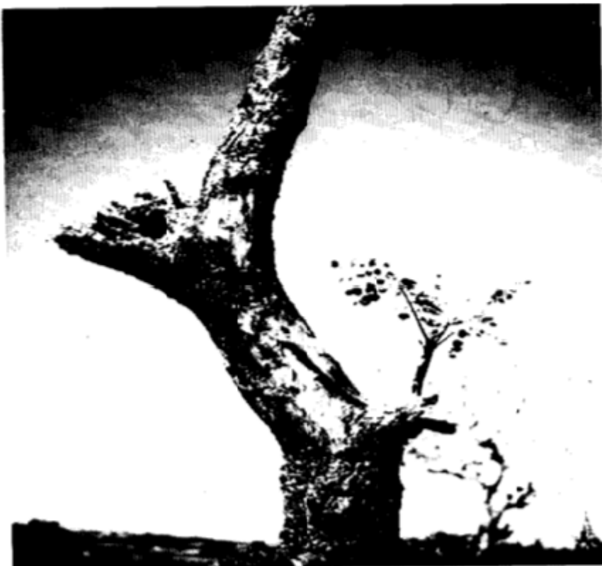
FIGURA 1 – Striphnodendrum barbatiman (Barbatimão)